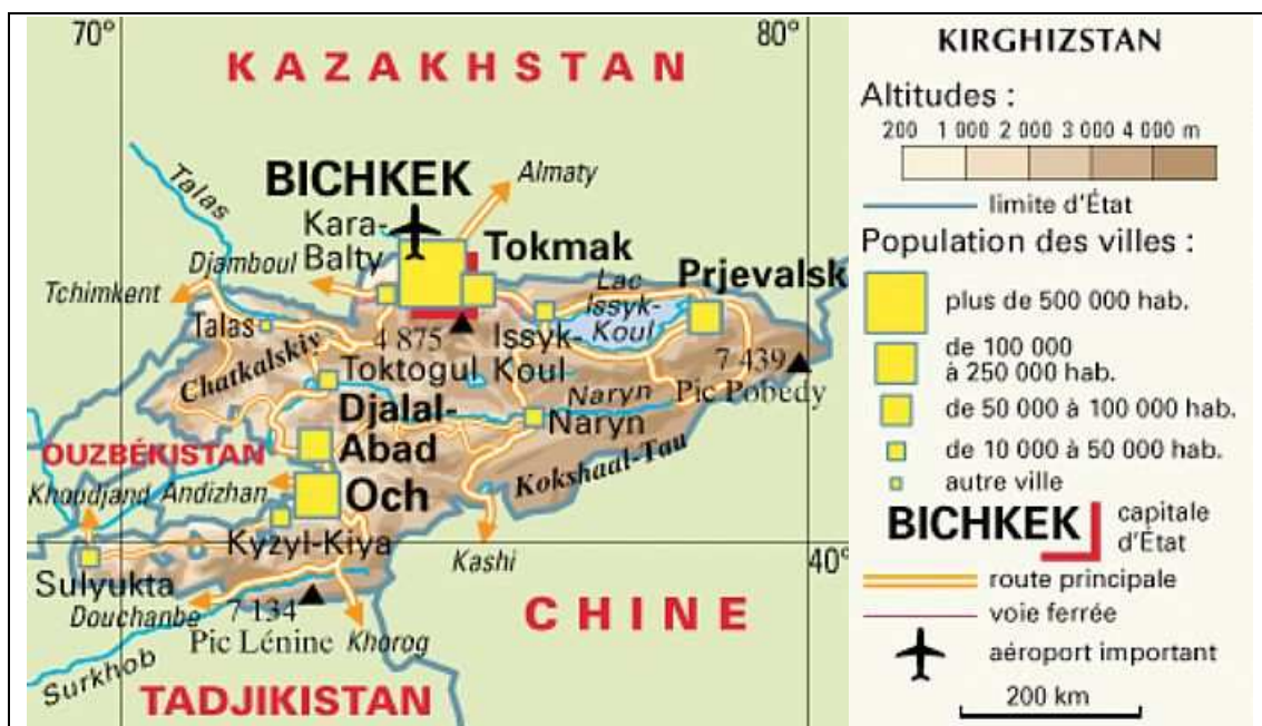
Population des villes

Source : SELIER Jean et André, Atlas des peuples d'Orient , Paris ; La Découverte, 2004.