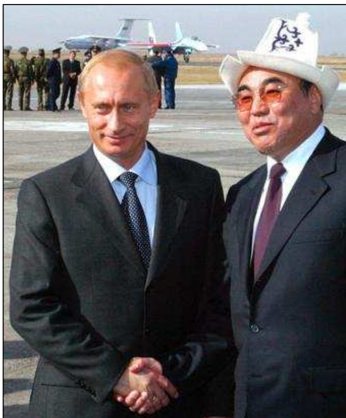
Photo 5: V. Poutine et A. Akaiev, lors de l'inauguration de la base russe de Kant

Après avoir, en décembre 2002, déployé des moyens aériens au Kirghizistan (à l'aéroport de Kant), la Russie a signé en septembre 2003 avec Bichkek un accord sur l'établissement d'une base aérienne russe à Kant, pour une durée de quinze ans, avec possibilité de renouvellement automatique de cet accord. Inaugurée le 23 octobre 2003 par le Président Poutine lui-même, cette base se situe à une trentaine de kilomètres de la base américaine Peter Ganci, à Manas. S'ajoutant à la présence militaire que la Russie maintient au Tadjikistan, la nouvelle base fait partie de la force de déploiement rapide de la CEI pour la région Asie centrale que l'Organisation du traité de sécurité collective a mise en place pour lutter contre les menaces de sécurité communes, notamment celle du terrorisme. La base russe doit assurer