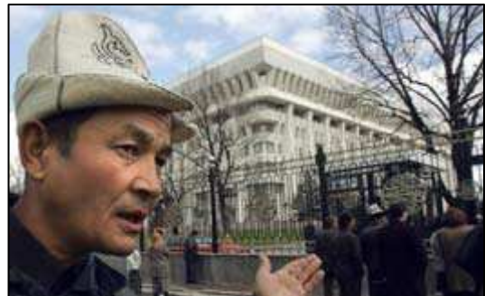
Photo 3 : Kirghize coiffé du kalpak 1 , devant à la « maison blanche ».